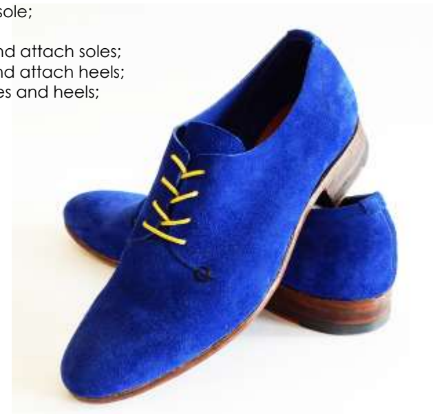
Chaussures style Derby réalisées par Niki Jessup