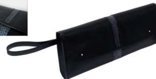
Pochette de soirée confectionnée par Sophie Gailliot